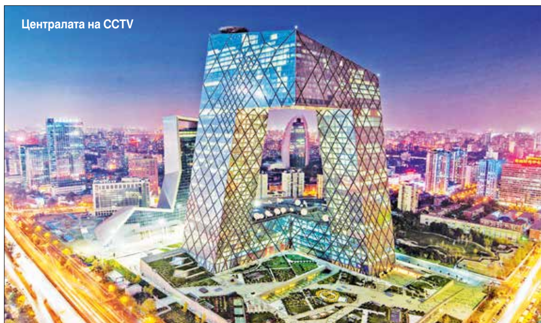
Централата на CCTV

Но управата на града отчита допуснатите грешки и работи за възстановяването на историческите архитектурни забележителности на града. Напълно е възстановена великолепната порта Юндинмън. Хутуните и старите квартали вече са обявени за защитена зона, наново се строят типичните правоъгълни композиции от постройки, обърнати с лице към вътрешен двор – съхъюен, и др.