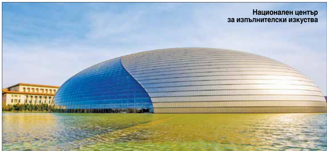
Национален център за изпълнителски изкуства

Разположен в Севернокитайската равнина, градът е защитен от север и запад от планината Линшан,