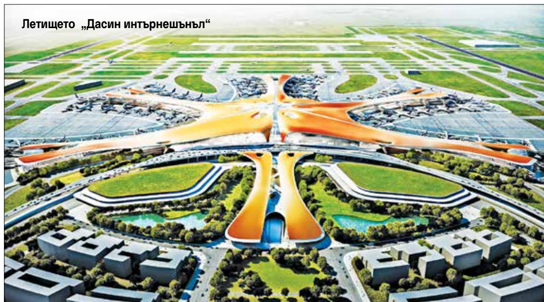
Летището „Дасин интърнешънъл“

градски улочки) отстъпват място на обширни жилищни райони с широки булеварди, търговски центрове, зелени площи и предприятия. Обликът на Пекин се променя – прокарват се нови улици, строят се околоръстни пътища с надлези и магистрали, прокарва се метро.