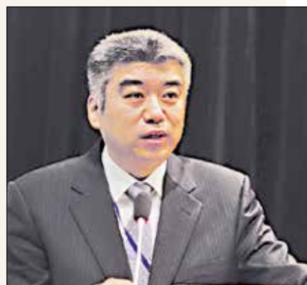
Чен Джоу, заместник-председател на Международния департамент на Централния комитет на Комунистическата партия на Китай, председател на Съвета на Асоциацията на мозъчни тръстове на „Един пояс, един път“

Уважаеми посланик Дун Сяодзюн, Уважаеми г-н Захариев, Уважаеми гости и колеги, Здравейте! Много се радвам, че мога да участвам в конференцията „100-годишнината от основаването на Комунистическата партия на Китай (ККП) и ролята и положението на Китай в световното развитие“ чрез видео.