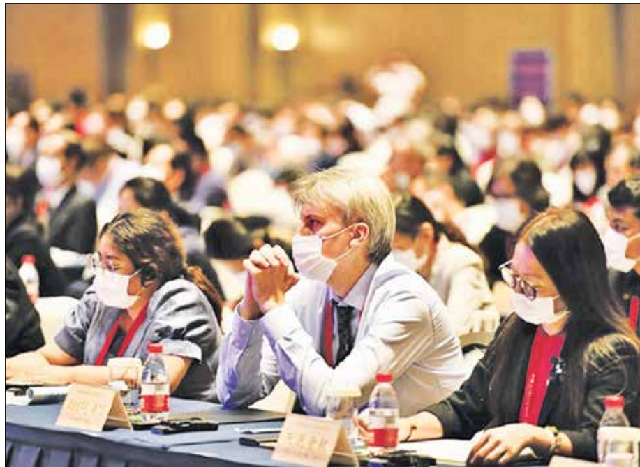
Участниците в Седмия културен форум за световните цивилизации в Цюфу, провинция Шандун, Източен Китай

тай и чужбина се съгласиха, че само сътрудничество, основано на диалог и взаимно уважение, е крайният изход за глобалните предизвикателства, пред които е изправено цялото човечество. Увереността им произтича от толерантността и разнообразието, вкоренени в китайската култура.