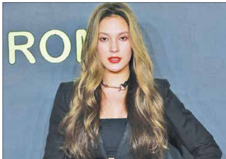
Прочутата китайска скиорка Гу Айлин е канена да се снима за Vogue, китайската версия на Elle, сп. „Bazaar“ и е участвала в Седмицата на модата в Париж

На 9 години младата спортистка печели Националното първенство по ски за юноши на САЩ; на 13 години участва в състезания за възрастни; на 14-годиши е вече притежател на титли от 50 първенства,