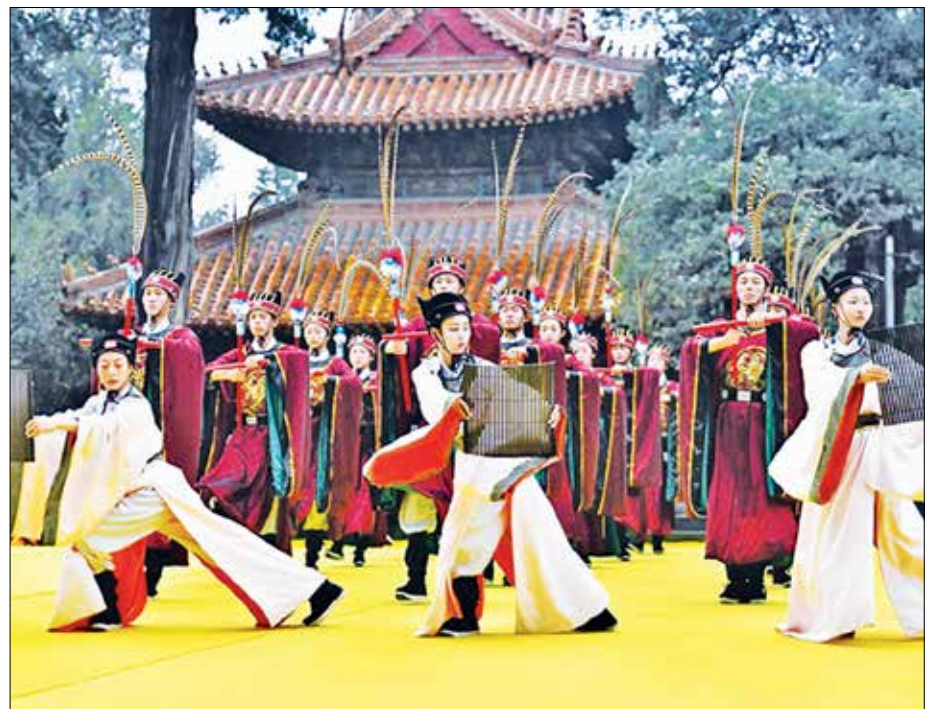
Церемонията, проведена в храма на Конфуций в Цюфу, Шандун, на 28 септември т. г. за отбелязване на 2572-рата годишнина от рождението на древнокитайския мислител Конфуций,

„Това е мирен път на развитие, ръководен от конфуцианството и