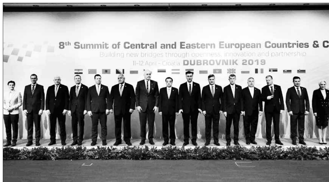
8-а среща по Инициативата „17+1“, Дубровник, 2019 г.

Макар че през последните няколко години износът на българска селскостопанска продукция и храни за Китай бележи известен ръст, все още предстои да се възползваме пълноценно от откритите се нови възможности. От важно значение е също стартирането на процедура за включване на продукти, съдържащи роза „Дамасцена“, в съответния разрешителен списък за хранителни продукти в Китай. Добра перспектива на китайския пазар има започналият износ на български вина, както и доставката на минерални и трапезни води.