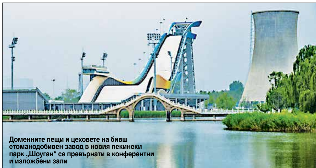
Доменните пещи и цеховете на бивш стоманодобивен завод в новия пекиния парк „Шоуган“ са превърнати в конферентни и изложбени зали

В пекиния парк „Шоуган“, където неотдавна се проведе Международното изложение за търговия с услуги, където след няколко месеца ще се проведат и някои от дисциплините на Зимната олимпиада, при изграждането на съоръженията личи решимостта на страната да изпълни набелязаните цели за намаляване на въглеродните емисии. Това подчерта Радио Китай за чужбина в репортаж за този известен парк, създаден на мястото на бивш стоманодобивен комплекс, който беше голям замърсител на околната среда в китайската столица. Неговата история датира от далечната 1919 г., а компанията днес има над 600 дъщерни дружества и 90 000 служители. По разmera на активите, „Шоуган“ е втората най-голяма компания за производство на стомана и желязо в Китай. Освен това от 2010 г. насам е неизменно част и от класацията на американското сп. „Форчън“ на 500-те най-големи компании в света. Преди