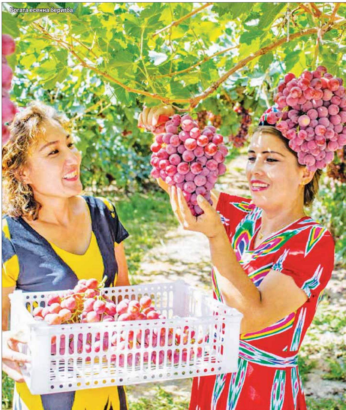
Богата есенна беритба